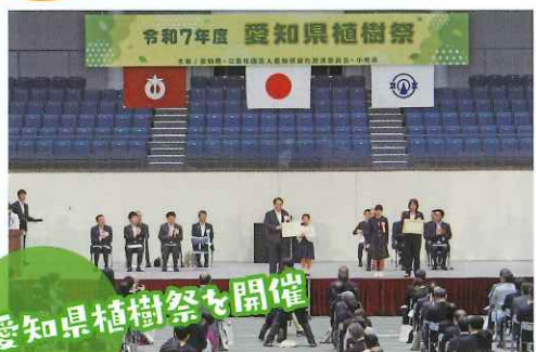
愛知県植樹祭を開催