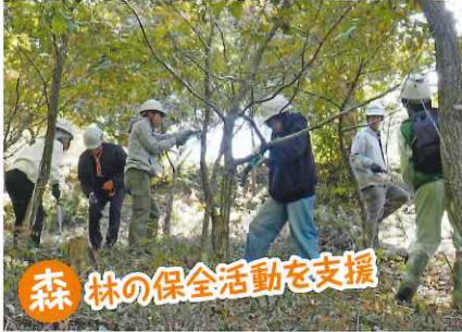
森林の保全活動を支援