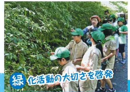
緑化活動の大切さを啓発