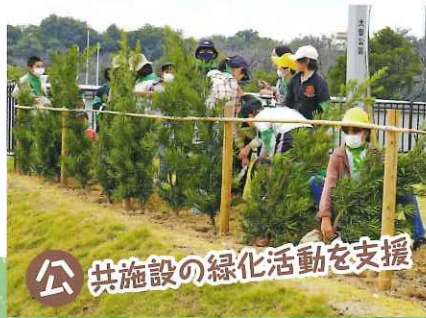
公 共施設の緑化活動を支援