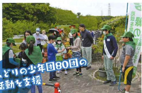
みどりの少年団80団の 活動を支援