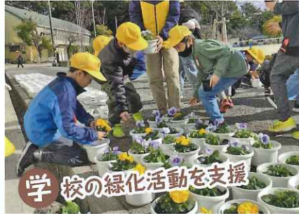
学校の緑化活動を支援