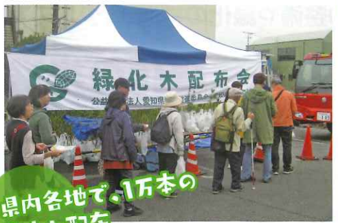
県内各地で、1万本の 苗木を配布