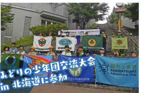
みどりの少年団交流大会 in 北海道に参加