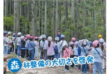
森林整備の大切さを啓発