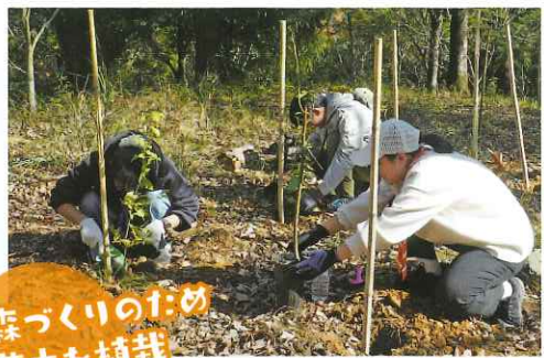
森づくりのため 苗木を植栽