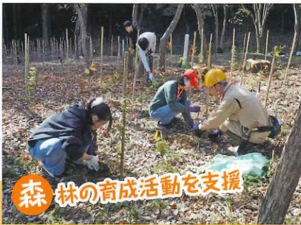
森林の育成活動を支援