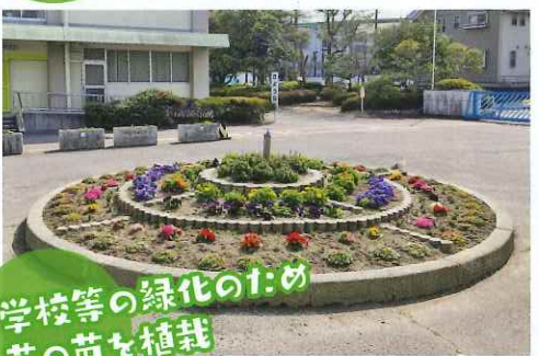
学校等の緑化のため 花の苗を植栽