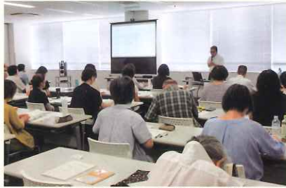
〈とよた市民後見人養成講座の様子〉