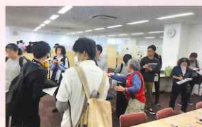
〈災害ボランティアコーディネーター養成講座の様子〉

地域福祉人材の育成と活躍支援の拡充を目指して、ボランティアセンター、とよた市民福祉大学等による地域福祉以外の分野とも連携できる協議体としての役割を強化します。